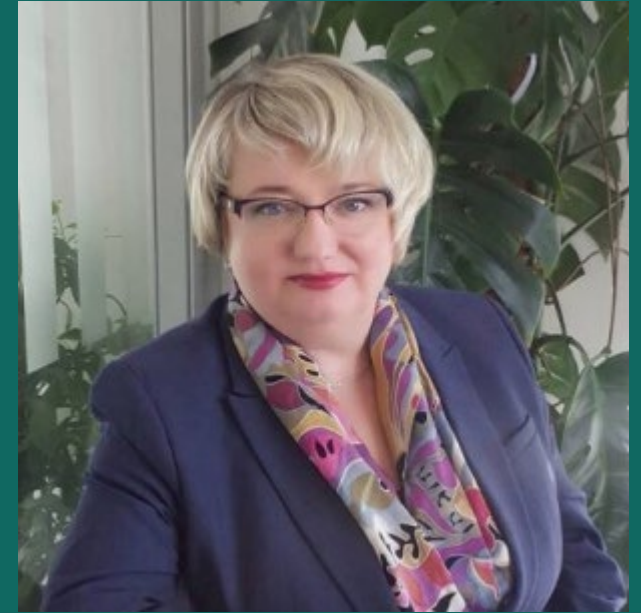
Заступник Голови ЄБРР в Україні Леся Кузьменко

Відмова учасників ринку від виконання форвардних контрактів підриває репутацію цілого сектору та погіршує інвестиційний клімат. Багато покупців зерна змушені будуть переглянути свої портфелі префінансування майбутнього врожаю і це знизить доступність фінансування для товаровиробників»