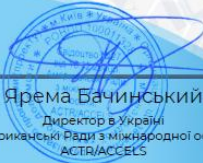
Ярема Бачинський Директор в Україні Американської Ради з міжнародної освіти: ACTR/ACCELS