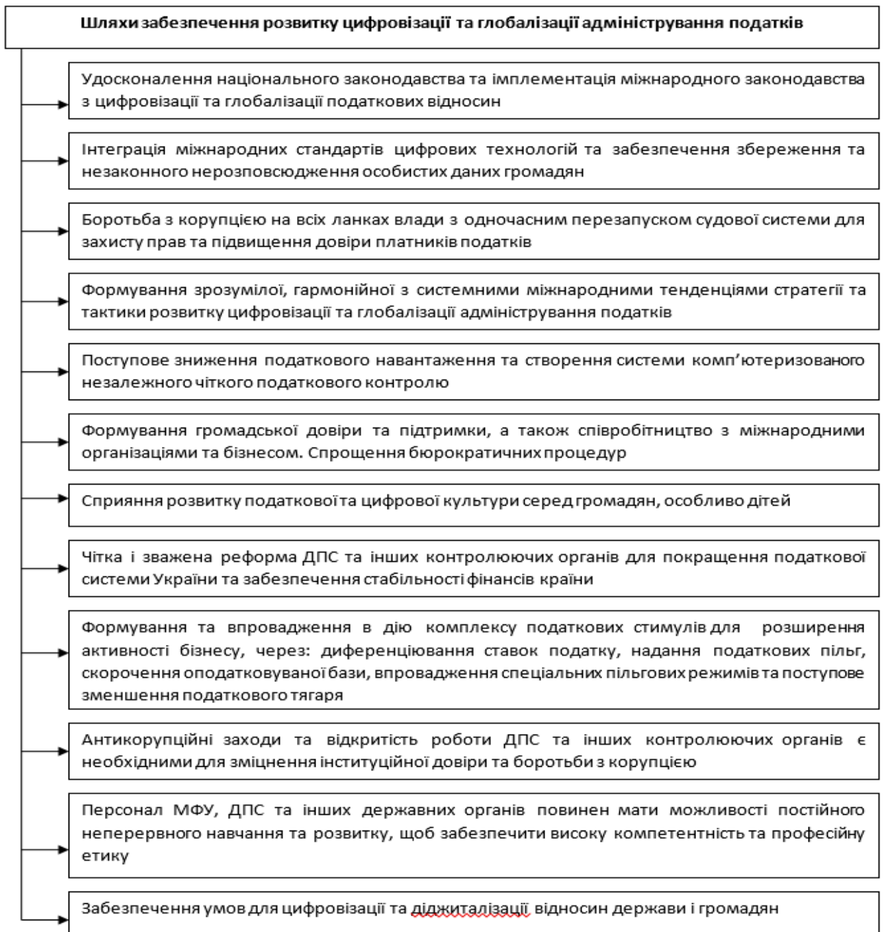
Рис. 1. Стратегічні пріоритети забезпечення розвитку цифровізації та глобалізації адміністрування податків