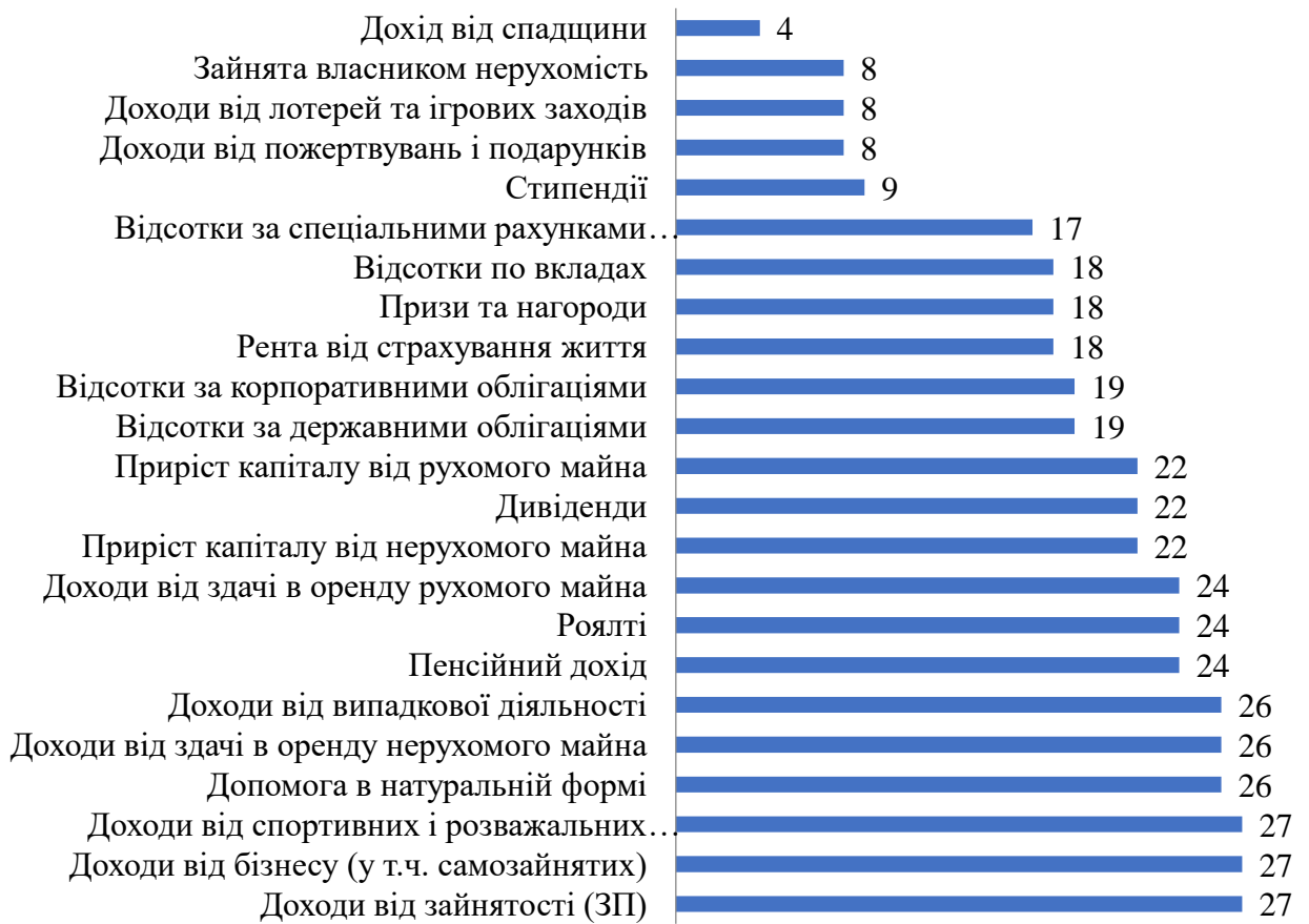
Рисунок 1 – Види доходів та їх оподаткування у розрізі країн ЄС

Як видно з рис. 1 із 23-х наведених видів доходів лише три оподатковуються у всіх країнах ЄС: дохід від трудової діяльності, доходи від бізнесу фізичних осіб, доходи від спортивних та розважальних заходів.