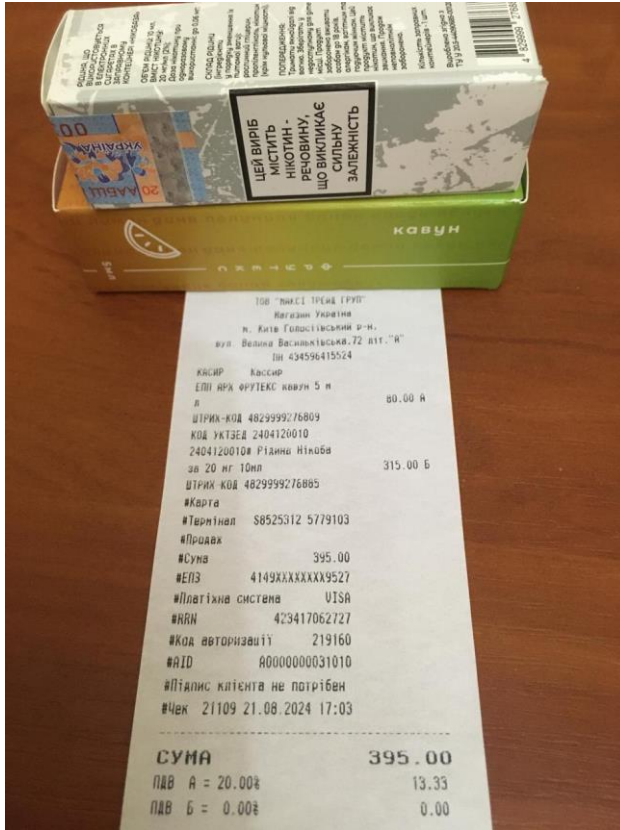
Фото контрольної закупки фахівців Економічної експертної платформи