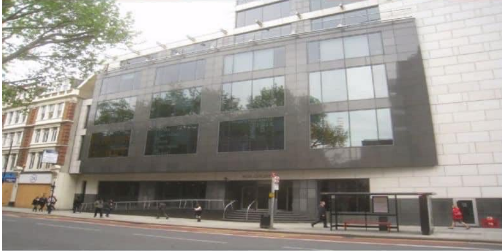
— Social security tribunal, London